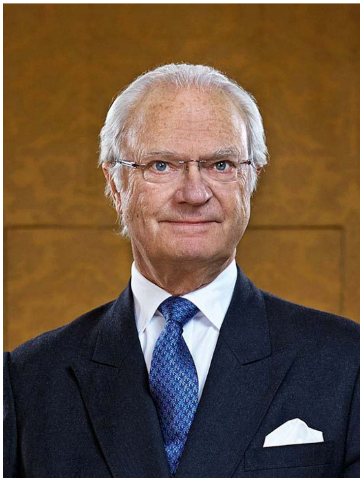
Hans Majestät Carl XVI Gustaf Sveriges Lions beskyddare