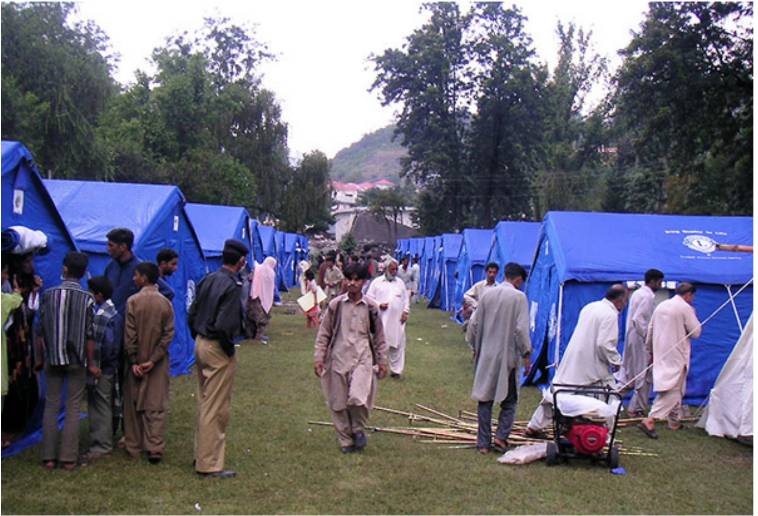
Lions tält i Pakistan efter en jordbävning.