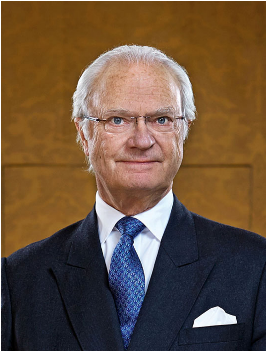
Hans Majestät Carl XVI Gustaf